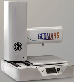
پرینتر سه بعدی سرامیک خانگی