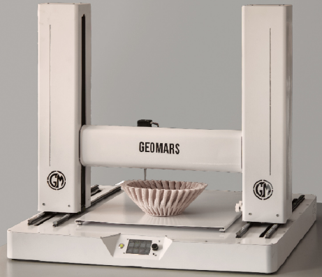
پرینتر سه بعدی سرامیک صنعتی